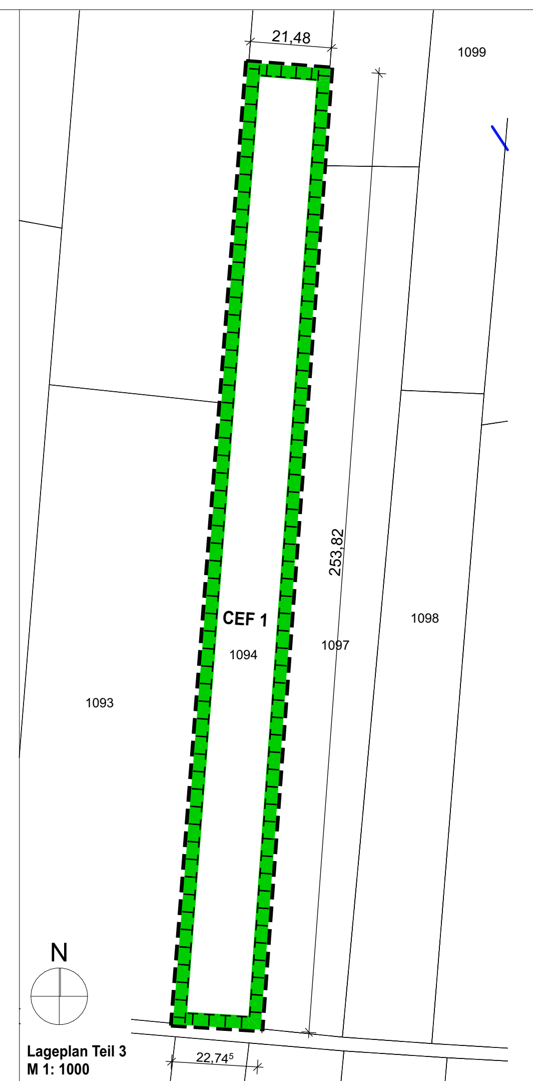
Lageplan Teil 3 M 1: 1000