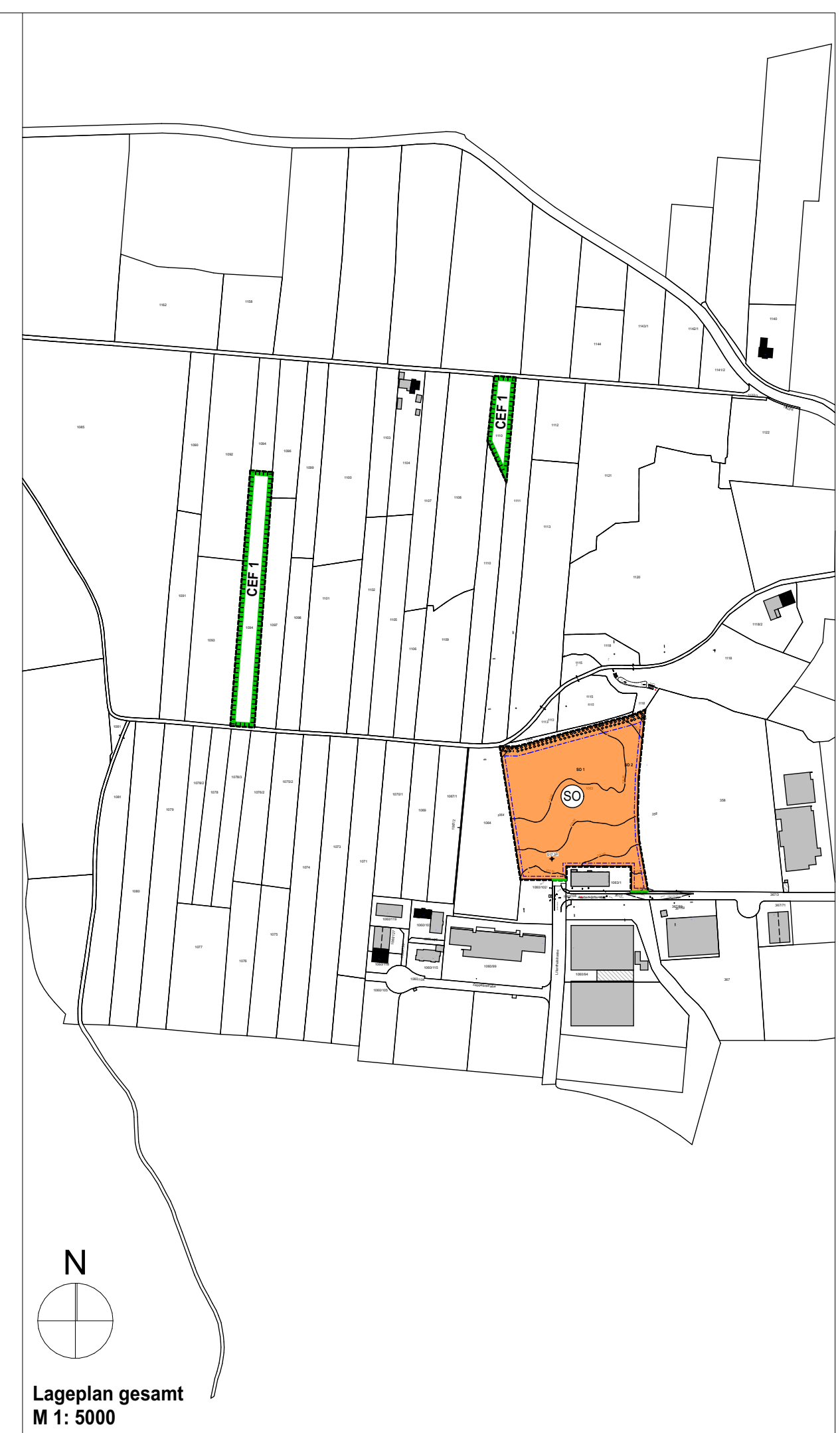
Lageplan gesamt M 1: 5000